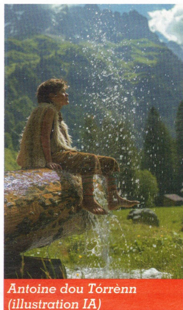
Antoine dou Torrènn (illustration IA)