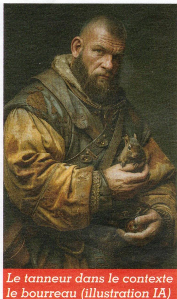
Le tanneur dans le contexte le bourreau (illustration IA)